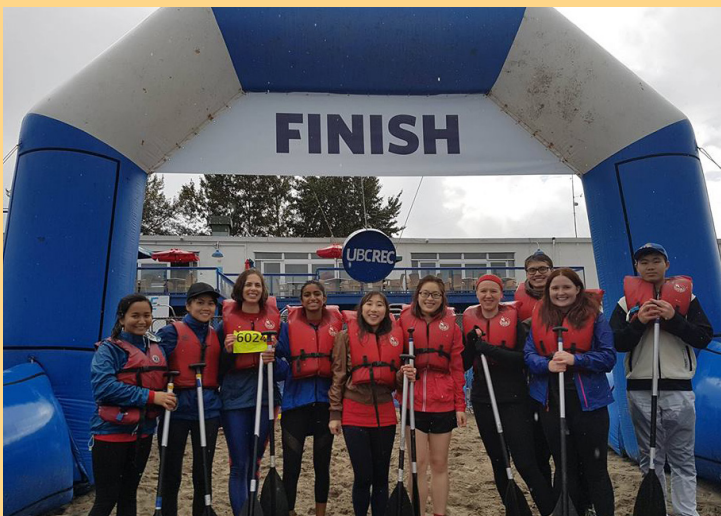
DAY OF LONGBOAT

La faculté de Pharmacie de l'Université de Le programme PharmD à UBC est l'un des rares programmes de pharmacie au Canada qui donne l'accès direct à la pratique. Chaque sujet étant enseigné par un instructeur hautement spécialisé dans son domaine, qu'il soit un professeur de l'Université ou un pharmacien clinicien invité, les étudiants en pharmacie reçoivent une tonne d'information qui est soutenue par des preuves scientifiques ainsi que par de l'expérience de première main. Nous sommes aussi chanceux de pouvoir assister à différents séminaires qui nous en apprennent plus au sujet de ce que nous pouvons faire en tant que pharmaciens et qui nous inspirent à continuer de faire avancer les responsabilités des pharmaciens qui pourront nous permettre de prodiguer un excellent soin aux patients.