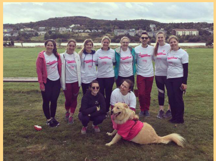
RUN FOR THE CURE