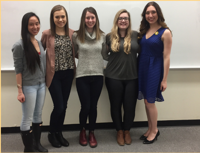
LAURÉATS DU PDW TRAVEL AWARD 2017 (IL MANQUE UN GAGNANT)

personnel de l'école de pharmacie, afin de promouvoir efficacement nos activités en ligne, par radio et par le bouche-à-oreille.