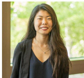
EDITEUR DU JACEIP INJEONG YANG