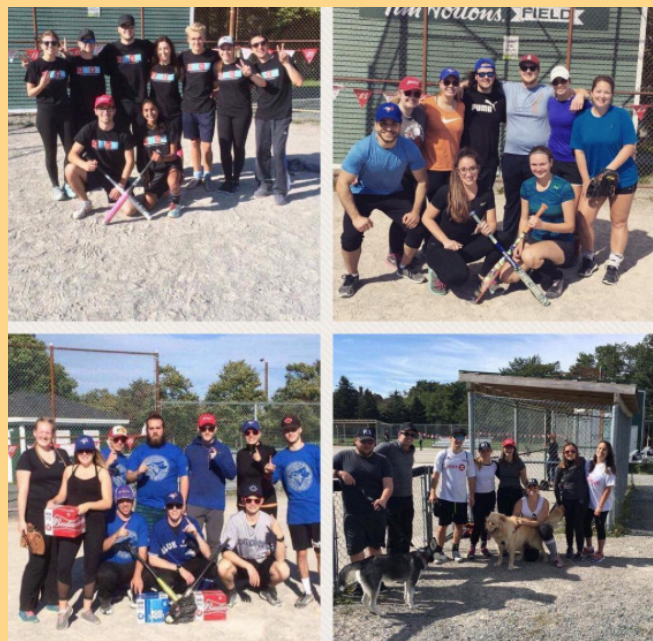
SAUVER LES EQUIPES DE TOURNOI DE BASEBALL DE DEUXIÈME BASE

Cette année, notre objectif principal était de promouvoir toutes les tâches supplémentaires que les pharmaciens sont désormais en mesure d'exercer à Terre-Neuve, telles que prescrire pour des conditions mineures ainsi que les injections. En ce qui a trait aux activités communautaires, le comité a installé une station pour le retour de médicaments au bénéfice du public général, a organisé un kiosque d'information dans un centre commercial, ainsi que des présentations pour des écoles primaires et secondaires locales. Le comité a travaillé en étroite collaboration avec l'Association des pharmaciens de Terre-Neuve-et-Labrador, et de